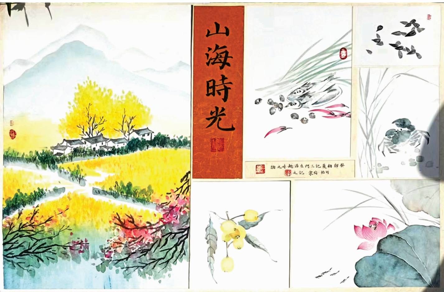
《山海时光》三门中学高一(1)班 郑可怡 祁筠棠