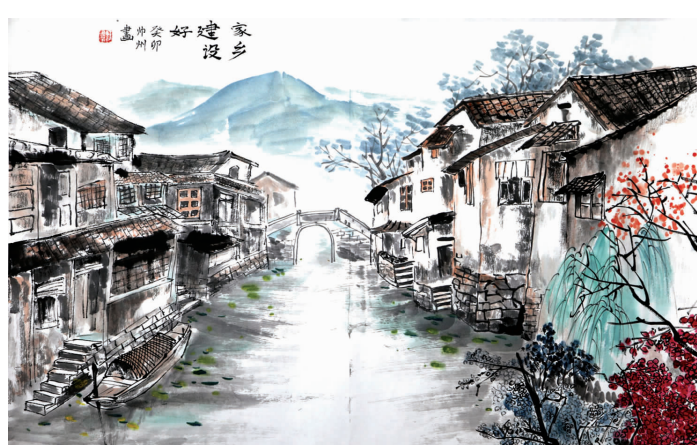
《家乡建设好 海游街道》海游街道初级中学 陈帅州