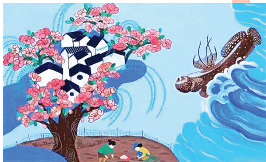
《共同富裕》县外国语小学二(5)班 梅恩溪