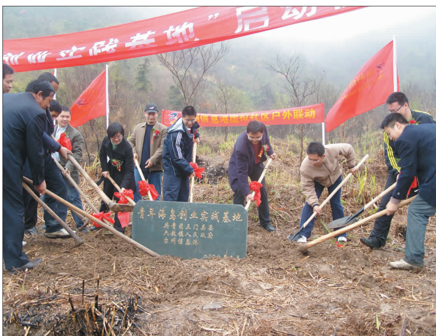
3月29日中午,在六敖镇田湾岛上,我县上百位青年冒着细雨来到这里,举行“青年海岛创业实践基地”奠基仪式,并种下“青年果树林”首批苗木。图为奠基仪式。(陈赛亚)

另悉,我县还将在今年6月、9月继续开展集中执行行动,确保社会抚养费征收取得新的突破。(程璞)